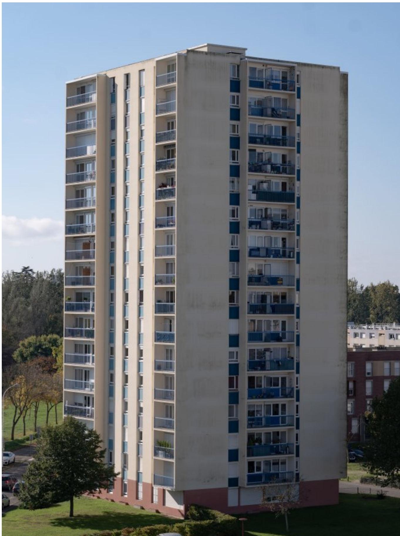
Quartier des Sablons, Le Mans par Emmanuel du Bourg