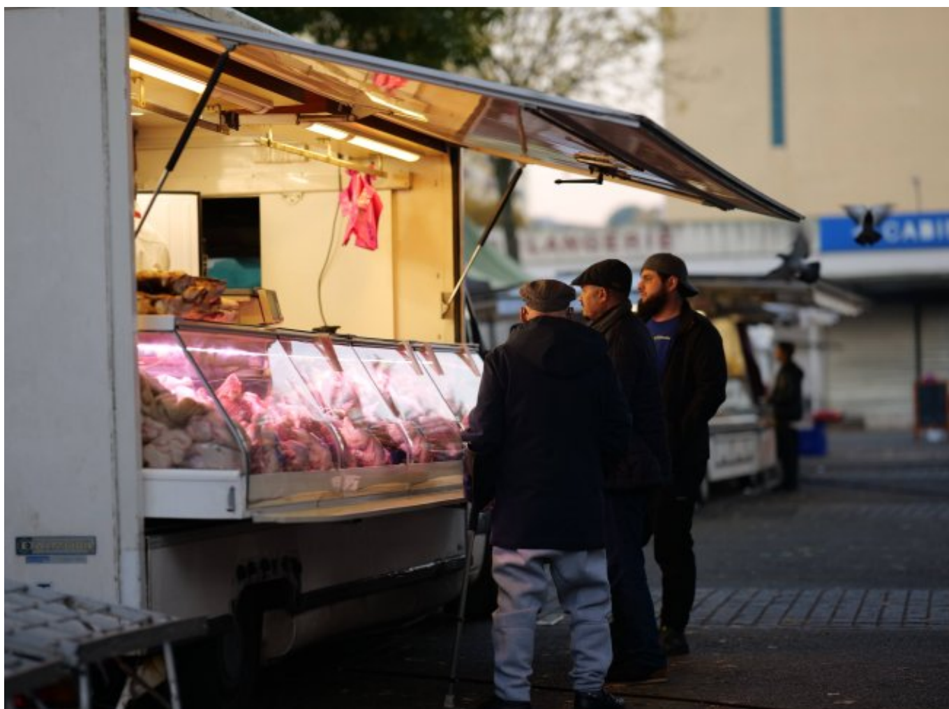
Quartier des Sablons, Le Mans par Emmanuel du Bourg

pacome.bertrand@developpement-durable.gouv.fr