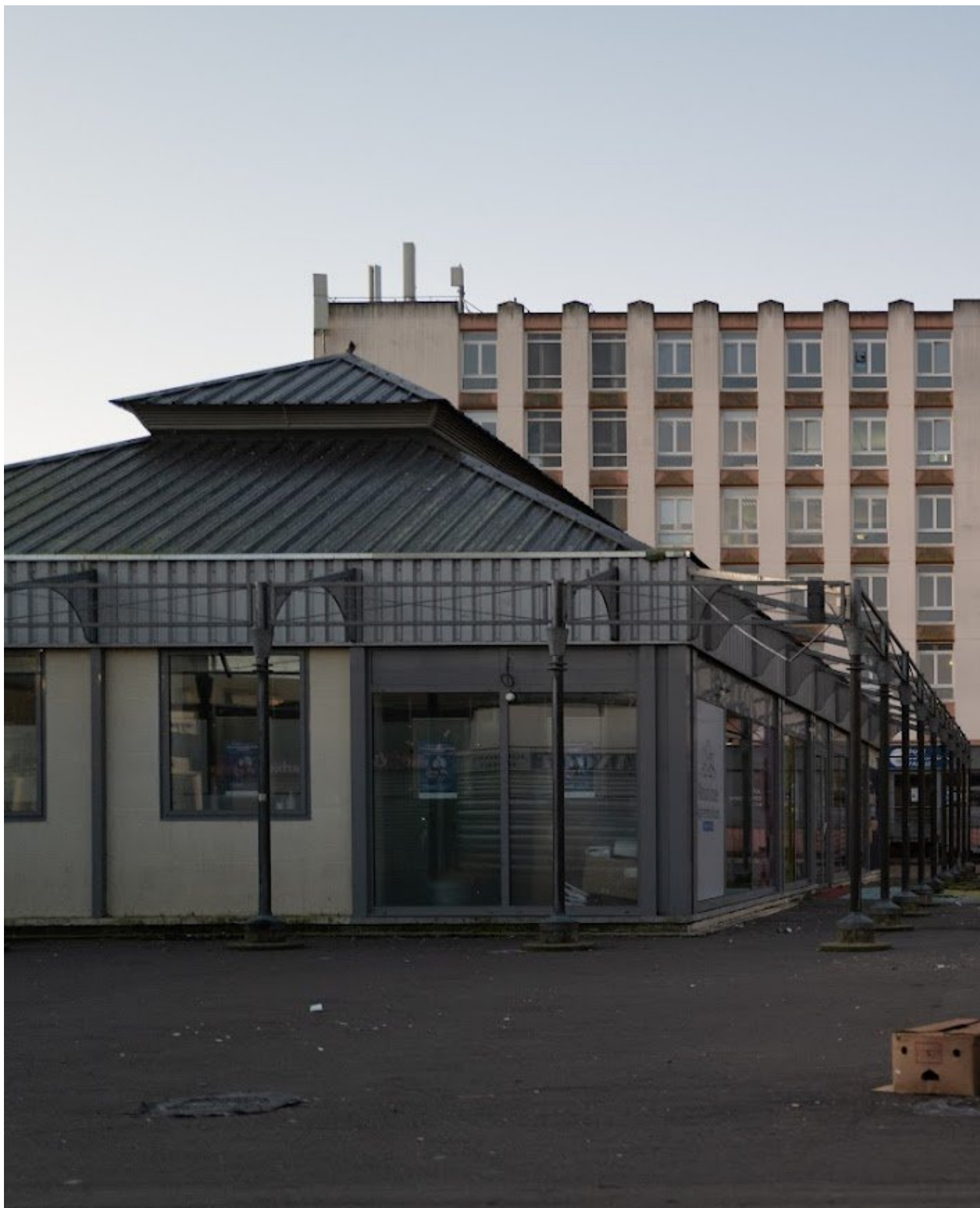
Quartier des Sablons, Le Mans par Emmanuel du Bourg