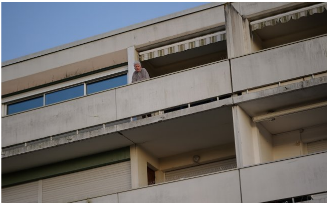
Quartier des Sablons, Le Mans par Emmanuel du Bourg