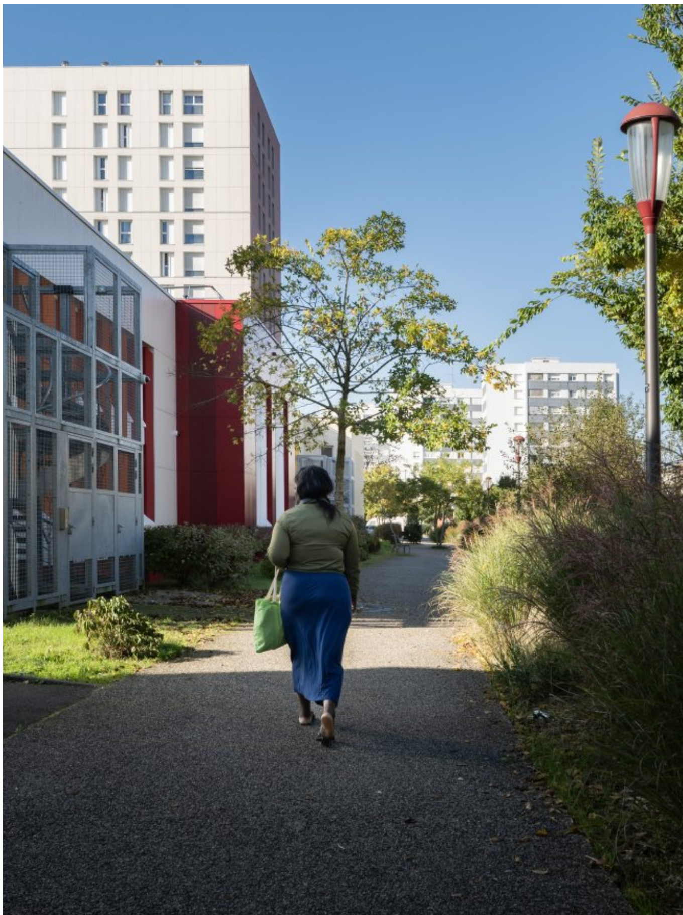
Quartier des Sablons, Le Mans par Emmanuel du Bourg